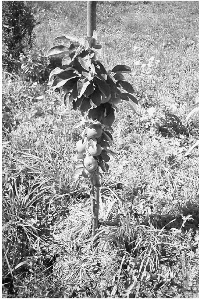
Колоновидная яблоня в новом саду.

На пороге встречает миловидная девушку. Приглашает в дом. Две небольшие комнаты, в глаза бросаются чистота